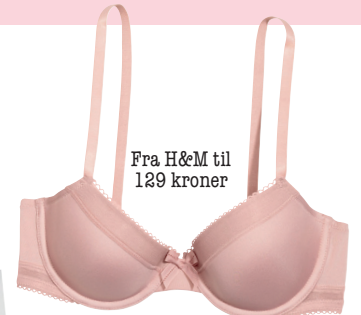
Fra H&M til 129 kroner