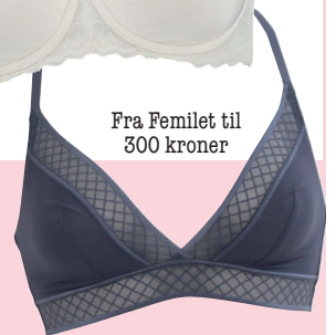
Fra Femilet til 300 kroner